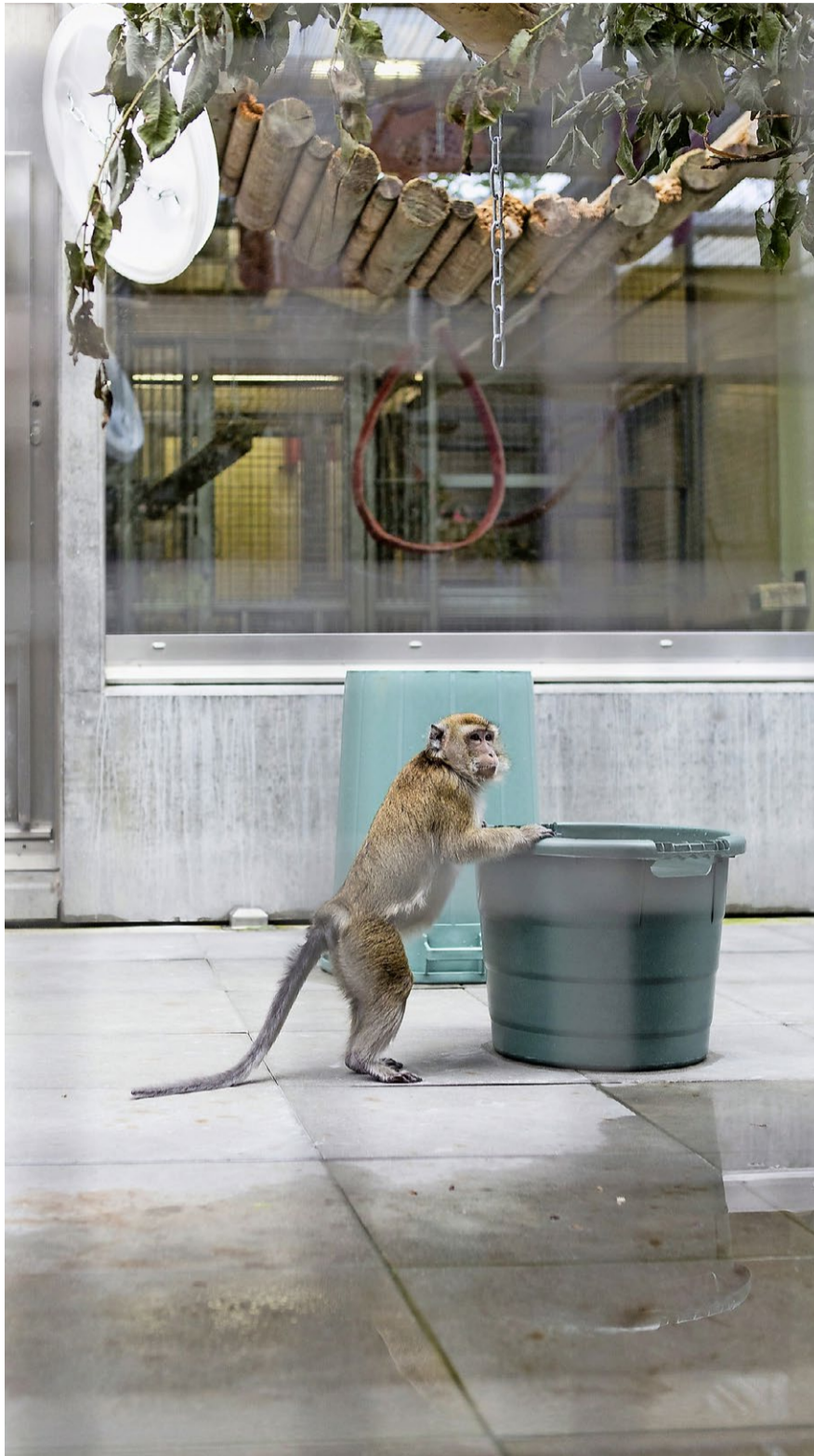
Dieser Javaneraffe lebte bis zum Umbau des Geheges am Irchel.

Ob Menschen Affen für biomedizinische Forschung und Entwicklung benutzen dürfen, ist eine Grundsatzfrage