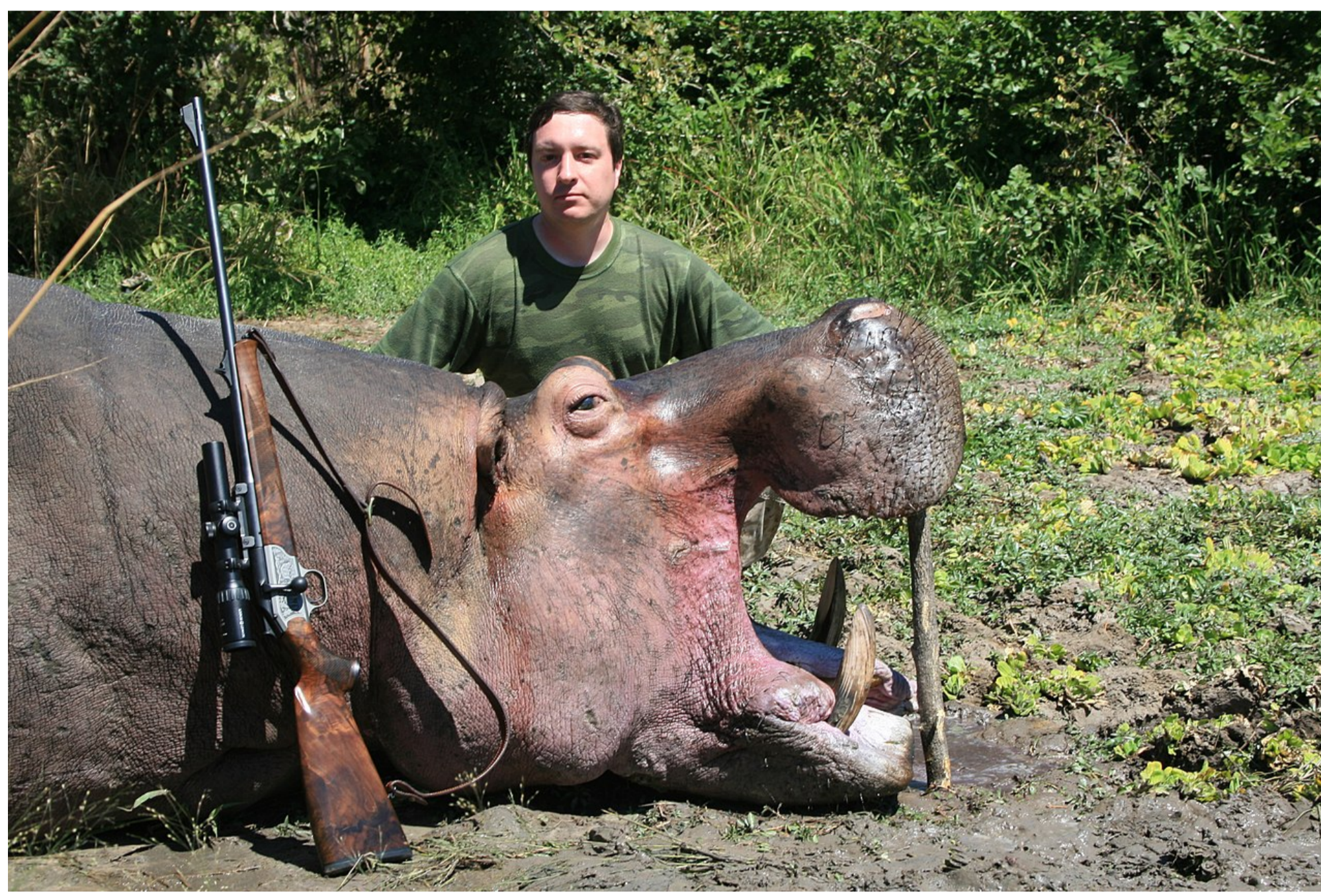
Eine beeindruckende Leistung: Ein Jäger mit einem toten Flusspferd